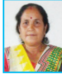
श्री गंगादेवी श्रेष्ठ गाउँपालिका उपाध्यक्ष