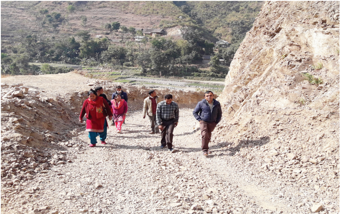
अनुगमन - डुडभनज्याङ्ग वडा नं. १