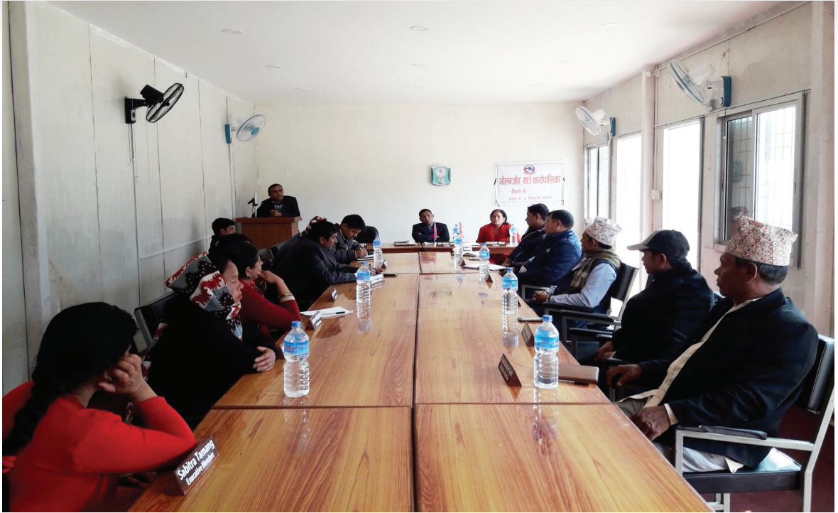
गाउँ कार्यपालिकाको बैठक