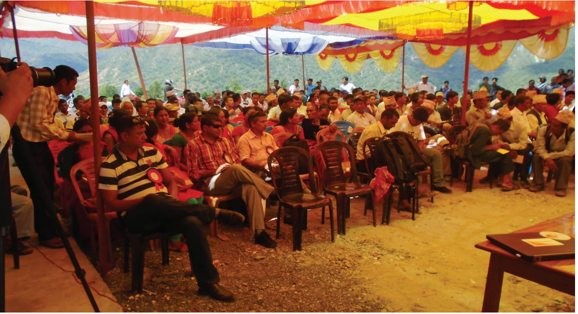
शिक्षा सुधार सम्बन्धी गोष्ठीमा सहभागीहरू