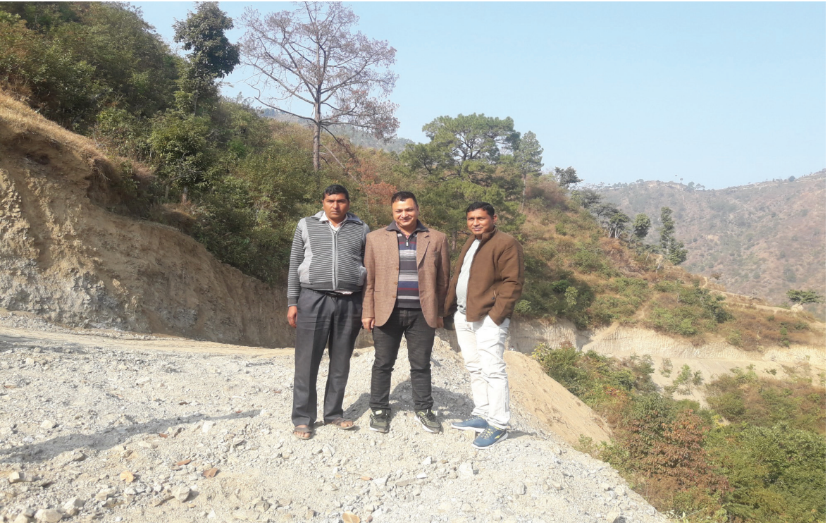
अनुगमन - सान्ने नागपोखरी वडा नं. ३