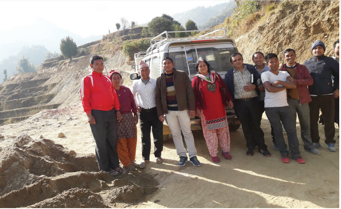
अनुगमन सिम्ले वडा नं. ४