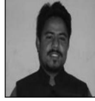
दौलत कार्की २ नं वडा अध्यक्ष